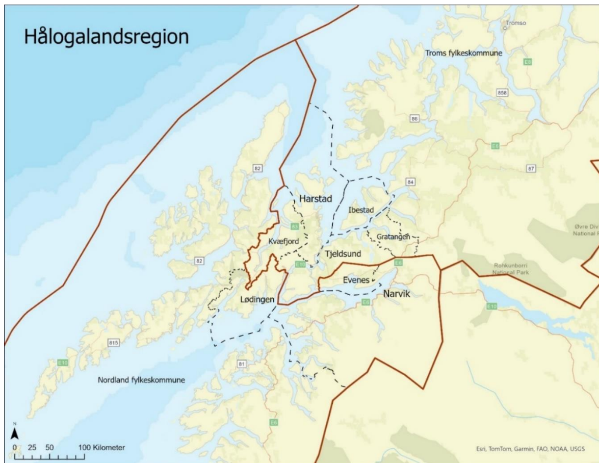
Figur 1 - Oversiktsbilde over Hålogalandsregionen. Laget selv i ArcGIS Pro, hentet kartdata fra geodata_levende_atlas og ka_gis.

Navnet på regionen «Hålogaland» er en regional inndeling som kommer fra gammelt av (Hålogalandsrådet, u.å A). Det er ikke et navn som brukes i det daglige, men regionens interkommunale samarbeid har tatt navnet – Hålogaland regionråd.