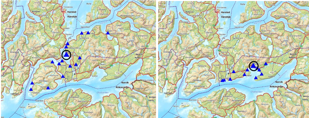
Figur 3 - Tjeldsund kommune, tettsteder – Norgeskart.no Figur 4 - Evenes kommune, tettsteder – Norgeskart.no