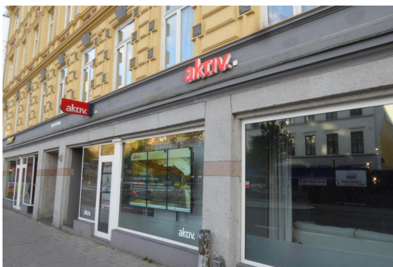
Figur 11. Eiendomsmegler – Aktiv Eiendomsmegling.