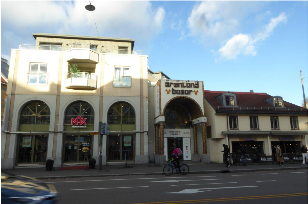
Figur 3. Grønland Basar.

Grønland Basar syntes jeg er feil plassert. Basar betyr et sted folk skal gå og handle, og prute. Levende. Senteret er bare sterilt. Navnet er vakkert, men butikkene er kjedelige. Butikkene åpner og stenger, forsvinner. Fordi de ikke har noe som appellerer til de som bor her.