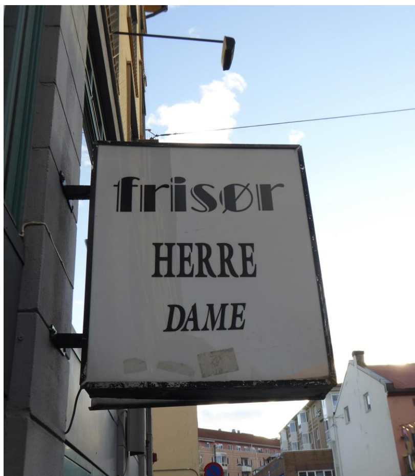
Figur 4. En av mange frisørsalonger på Grønland (Fotografi tatt av forfatteren).

eksisterer, blir handelsnæringen i området mer og mer homogen. Hun ser for seg en utvikling der flere av innvandrerbbutikkene forsvinner, og reflekterer rundt hvorvidt det i seg selv er negativt: «(...) samtidig så ser jeg jo heller ingen grunn til at alle grønnsaksbutikkene skal ligge her på Grønland, og alle skal komme hit og handle». Hun understreker videre at hun ikke ønsker at de skal forsvinne helt, men at «de fleste ville tjent på å spre seg litt». Dersom slike klassiske innvandrerbutikker etablerer seg flere steder i byen, vil man kunne få et mer mangfoldig Oslo i sin helhet. Som vi diskuterer videre, så handler det ikke om at man for å unngå å et gentrifisert Grønland, må bevare absolutt alle eksisterende butikker. En endring og tilførsel av nye butikker og aktører vil gagne området, derimot må det ikke gå for langt, slik at de gamle butikkene forsvinner.