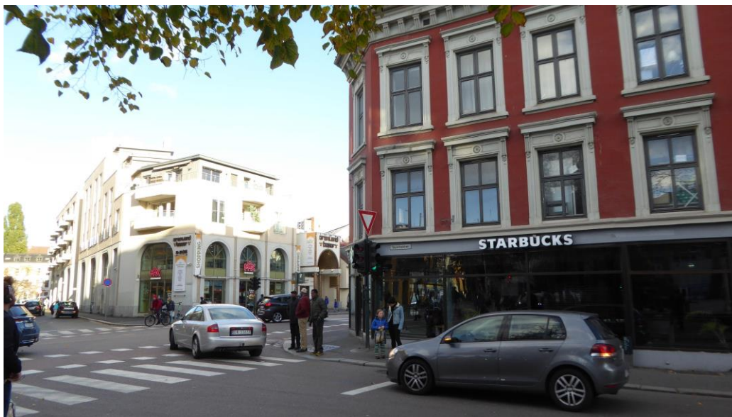
Figur 7. Nye spisesteder i området – Max burger og Starbucks.

Moustache forteller videre at han opplever at det er positivt at det etableres flere butikker og kafeer, men at han er skeptisk til karakteren ved disse stedene. Han uttrykker at han frykter at de spesielle småbutikkene skal bli erstattet av typiske kjedebutikker, slik som han kategoriserte Grønland Basar, og dermed oppleves homogent og kjedelig. Disse tankene om den kommersielle utviklingen på Grønland beskriver også Byforsker. Byforsker sier at dersom gatebildet på Grønland skal oppleves tryggere, så må det være mer vanlige folk i gatene. Dersom man får et livlig miljø i gatene, vil kanskje det bidra til at rusmiljøet trekker seg unna.