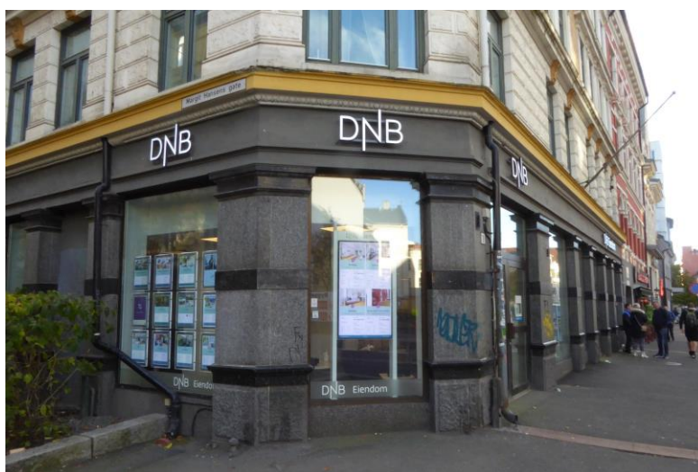
Figur 10. Eiendomsmegler – DNB Eiendom.

kjøpesterk middelklasse. Det at denne gruppen flytter til Grønland, og dermed trekker opp prisene, er noe Sæter og Ruud (2005) beskriver som en tendens man kan se i de sentrale byområdene i Gamle Oslo. Etablering av flere eiendomsmegler-forretninger i området kan også ses som et resultat av en slik tendens (Figur 10 og 11). En slik tendens sammenfaller med det Clay (1979) omtaler som gentrifiseringens andre fase , der middelklassens nye interesse for området vil føre til en økende etterspørsel av boligene, som igjen vil føre til en prisstigning på boligene. Clay (1979) argumenterer videre for at en slik utvikling vil kunne føre til en fortrenking av de opprinnelige beboerne i området. Dette er noe som samtlige informanter beskriver som en tendens man har sett på Grønland, og som særlig utviklingsagentene uttrykker bekymring om. Som Jagmann sier, vil det for å hindre at denne utviklingen fortsetter, være behov for en endring i boligpolitikken for området.