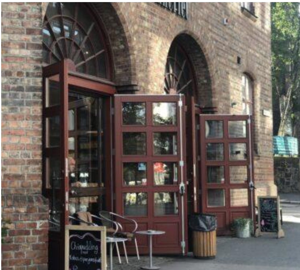
Figur 9. Kaffebar – Kaffebrenneriet