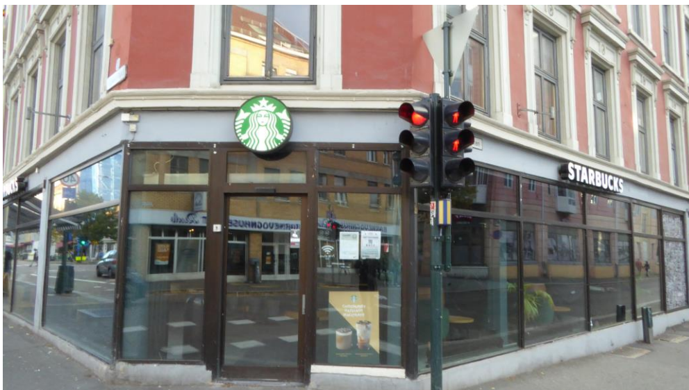
Figur 8. Kaffebar – Starbucks.