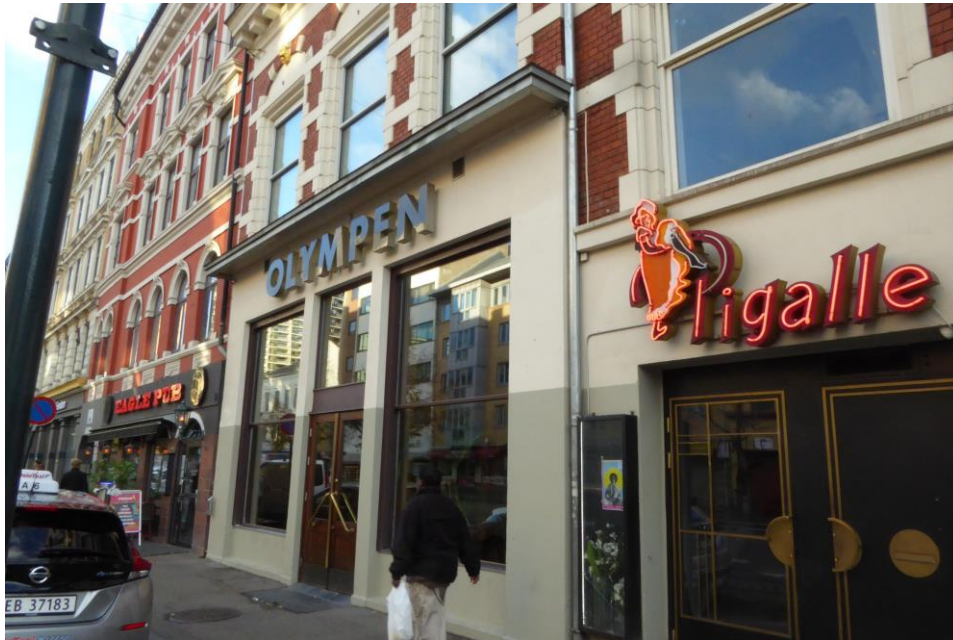
Figur 6. Restauranter med lang fartstid i området (Fotografi tatt av forfatteren).