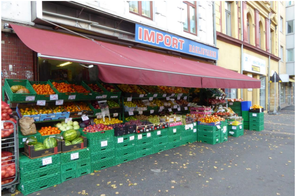
Figur 5. Grønnsakforretning.

Konkluderende bemerkninger om Grønlands stedsutvikling er at denne har forløpt i tråd med gentrifisering i den forstand at området gradvis forsøkes og lykkes oppgradert i håp om å tiltrekke en ny gruppe mennesker. Derimot har man siden år 2000 spesielt sett en stagnasjon, der områdets omdømme setter begrensninger for den videre utviklingen. Dette søker områdeløftet å gjøre noe med. Jeg vil nå trekke frem beskrivelsen av Grønland som levende og mangfoldig, før jeg går inn på de utfordringene knyttet til levekår, rus og kriminalitet og den territorielle stigmatiseringen som oppstår på grunn av dette.