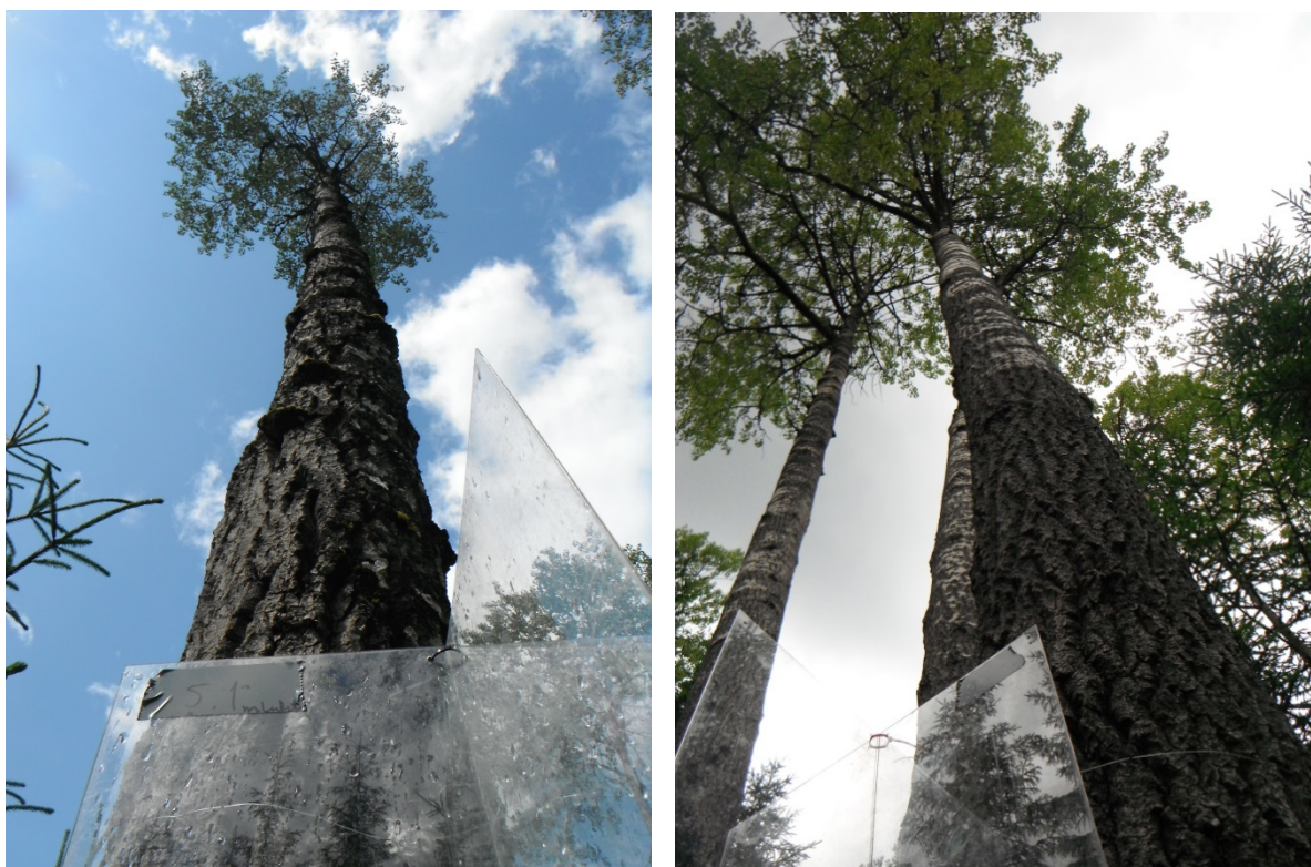
Figur 2. De fleste ringbarkede trærne levde fortsatt. Felle 5.1 (til venstre) og 1.1 (til høyre).