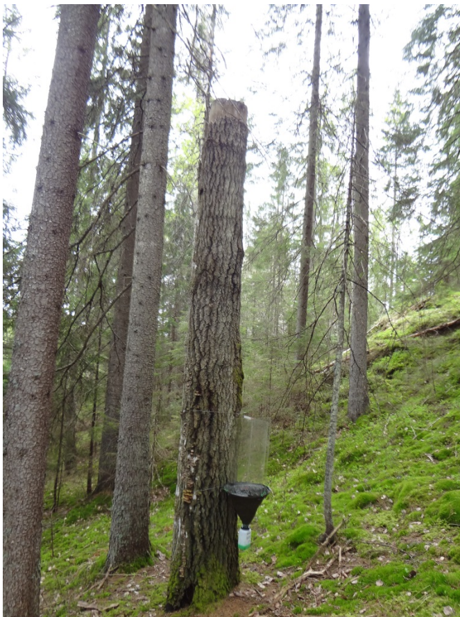
Figur 4. Vindusfeller på høystubber av osp. Noen av høystubbene er preget av gjengroing (f.eks. felle 115 øverst til venstre), andre ikke (f.eks. felle 204 øverst til høyre). Enkelte av høystubbene har fortsatt mye bark (f.eks. felle 109 nederst til venstre).