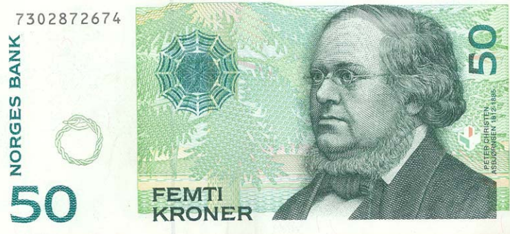
Figur 2. Asbjørnsen er kanskje den eneste forstlige forfatter som er blitt avbildet på en pengeseddel.