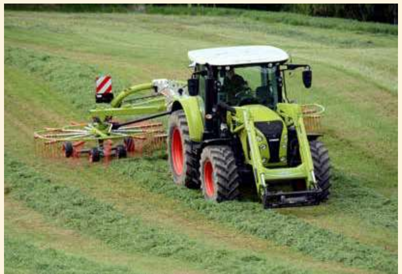
Tørk raskt og/eller bruk konserveringsmiddel for å konservere sukker og energi til vom-mikrobane si proteinsyntese, er ei god oppskrift for høgare proteinverdi i surfôret.

Avhengig av avdråtsnivå og grovfôrqualität, vil grovfôret kunne dekkje mellom halvparten og nesten heile behovet for protein, uttrykt som behovet for aminosyrer absorbert i tarm (AAT). Dette