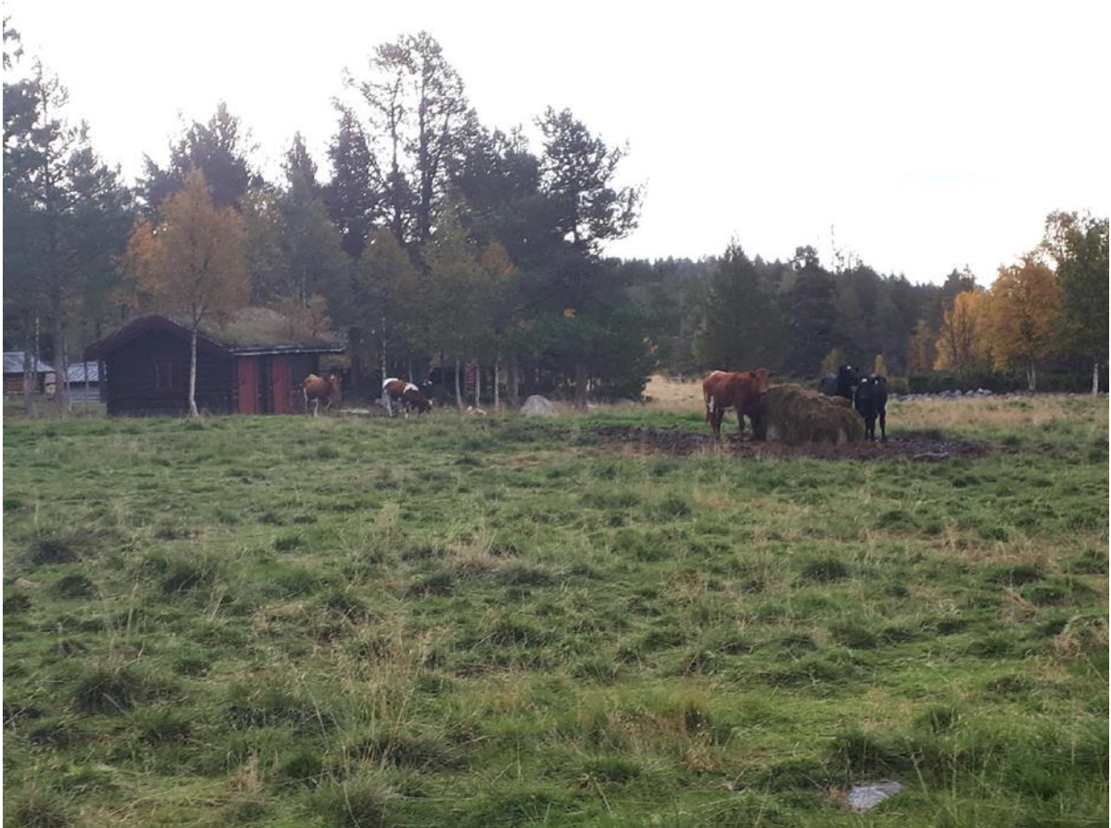
Figur 12 Engerdal, foto privat

seterretten. Jeg tenker nok mer inn mot turisme/ fritid, men om det skulle komme noen i en senere generasjon som ønsker å drive landbruksdrift, så har man muligheten, sier informanten. Det tror jeg kan være lurt å beholde seterretten i hevd i den grad en klarer det, da jeg tror dette kan føre til at det blir gjort mer på setra da man får mer «eierforhold». Om ingen har en type «eierforhold» til det tror jeg hvert fall det blir nedprioritert, legger informanten til.