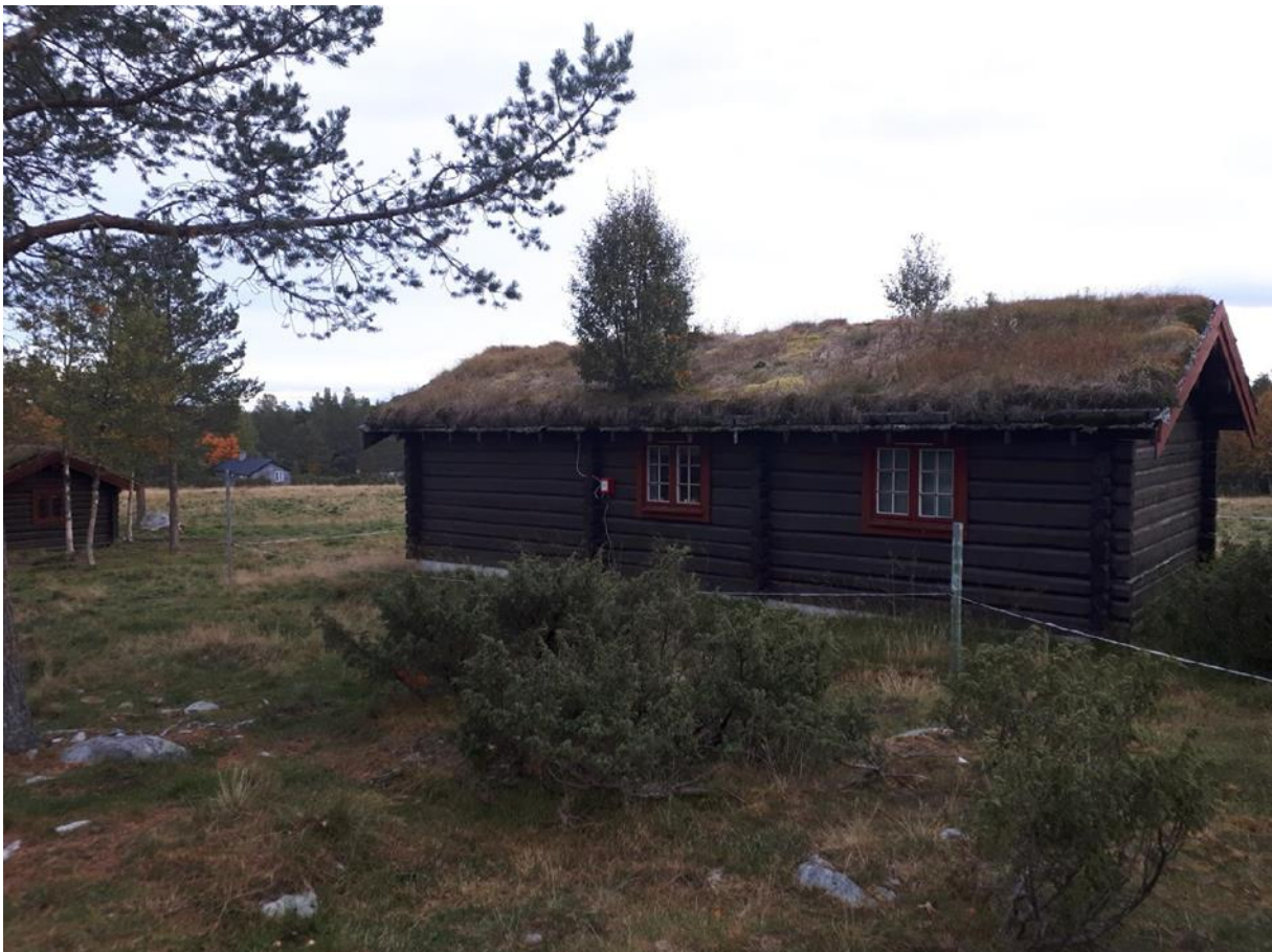
Figur 11 Engerdal

På setra til den tredje informanten står det oppført ei hytte som ble satt opp på 70-tallet, men at de eier den i dag. I tillegg til seterhusa. Det er bevart den opprinnelige stilen, og vedlikeholdt. Gulvene og takene er blitt isolerte, slik at det er mulig å være der både sommer og vinter. Det er primitivt uten innlagt vann og strøm, men lagt inn solcellepanel og vann på sommeren. Seterhusene har noen endringer, for ivaretagelse og for å gjøre det mer brukervennlig, men husene som sto der opprinnelig er i hovedsak bevart, sier informanten.