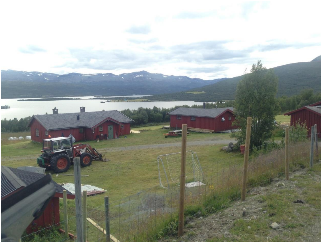
Figur 6 Vestre Slidre