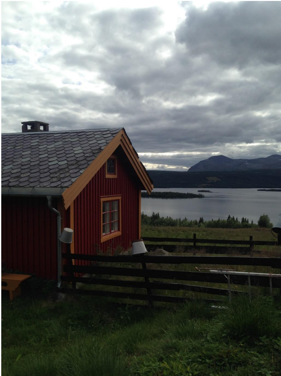
Figur 3 Vestre Slidre, foto privat

Alle gårdbrukerne har tilleggsjobber/tilleggsnæring.