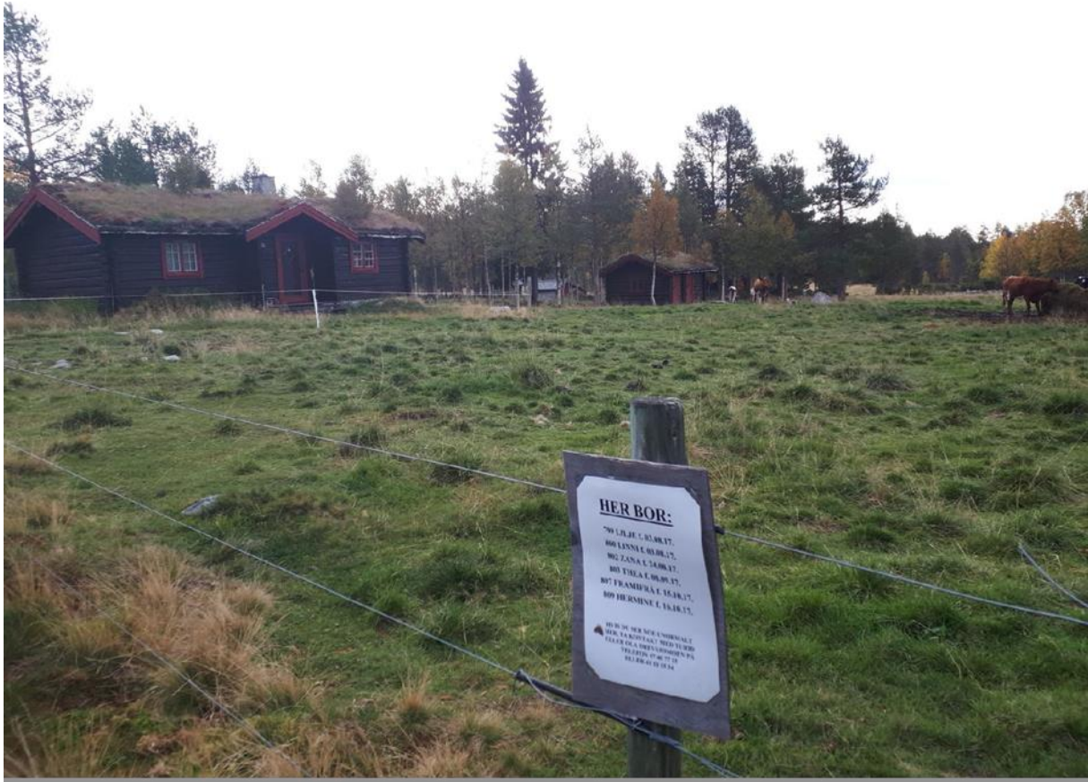
Figur 10 Engerdal, foto privat