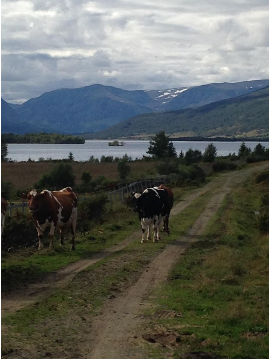
Figur 7 Vestre Slidre