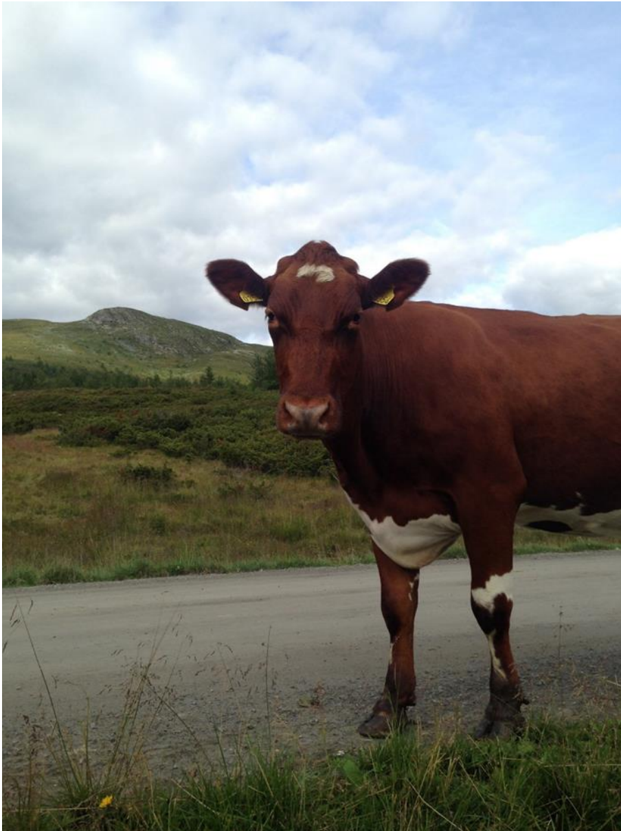
Figur 9 Vestre Slidre, foto privat

Informanten sier seg enig i at det er mer behov for arealene her hvor det er aktive seterbruk, og sier at hvis det er flere setre som er i bruk ved siden av hverandre, også blir en ledig, da er det veldig greit at vi bruker det ledige arealet til beite, hvis det er passe oppdyrka. Er det en gammel setervoll er det greit å bare ha som beite i perioder. Spesielt på slutten av sesongen, når det er dårligere beiter.