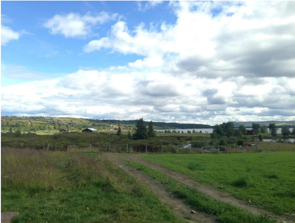
Figur 2 Vestre Slidre