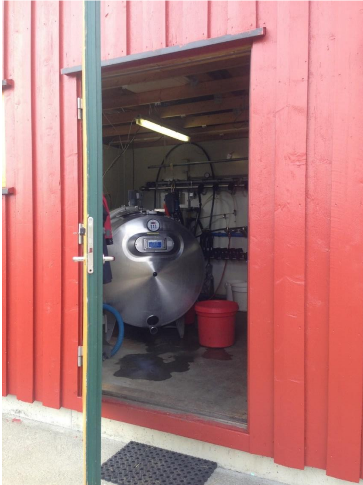
Figur 5 Vestre Slidre