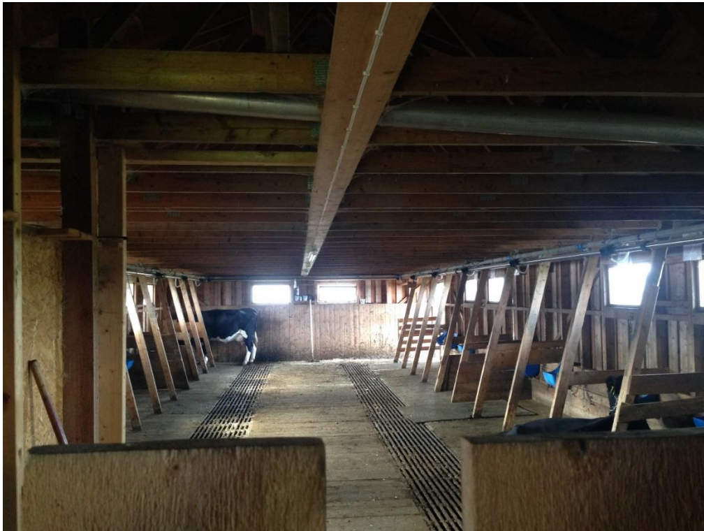
Figur 4 Vestre Slidre

Den tredje informanten forteller at de har hovedhus med en gammel og en ny del. De bruker mest den nye delen, men den gamle delen er restaurert med tilskudd da den er verneverdig. Huset kan brukes hele året, men det er likevel enkel standard uten bad, utedo, kun innlagt kaldt vann, og dermed beregnet mest for dagens bruk. Det er ønskelig å få i stand et bad i hovedhuset, for å gjøre det lettere å være der, men de har ikke prioritert den investeringen. Fjøset er gammelt, men modernisert i senere tid med rørmelkssystem og påbygd melkerom.