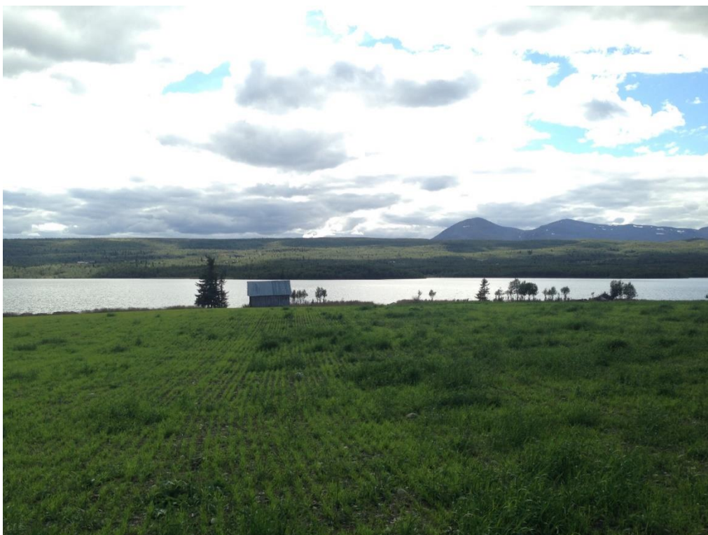
Figur 8 Vestre Slidre