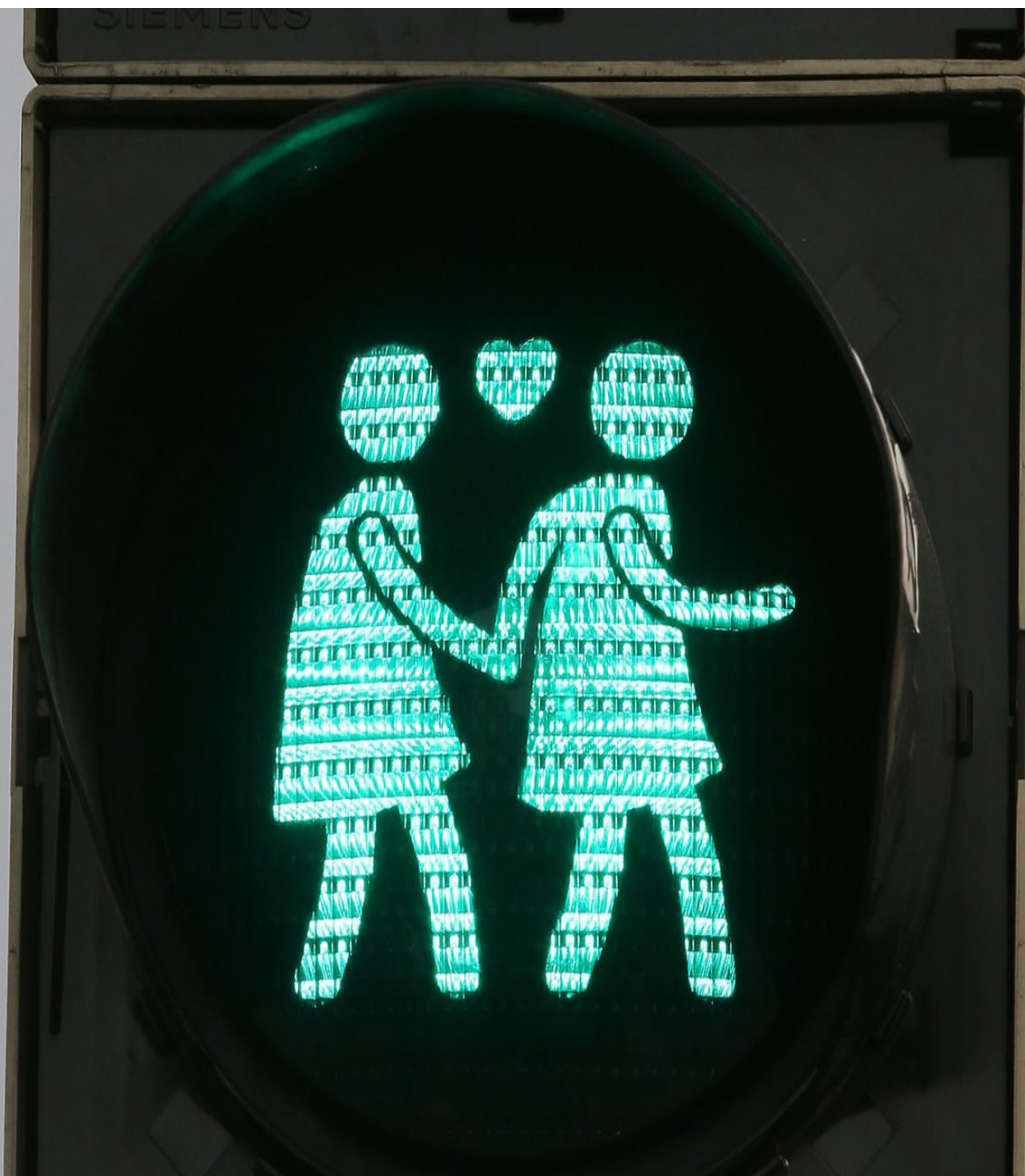
Figur 2: Wien i Østerrike er et av landene som har inkorporert gender mainstreaming i planleggingen. Kjønnsfokuset vises også gjennom noen av trafikklysene: Funnet: 10.05.18 https://www.lgbtqnation.com/2015/05/vienna-traffic-signals-go-red-and-green-gay-and-straight/

Etter å ha gjennomgått teorier som ser på kjønn og planlegging har jeg sett sammenhengen mellom diskurs, institusjonalisering og praktisering tydeligere. De ulike delene bli en sammenheng med komponenter som ikke fungerer eller kan forklares uten den andre. Fokuset på diskursen som i utvikling, blir også bekreftet gjennom tidligere arbeid om kjønn i planlegging og andre fagområder. Dette bidrar og klargjør det videre arbeidet med oppgavens metodikk.