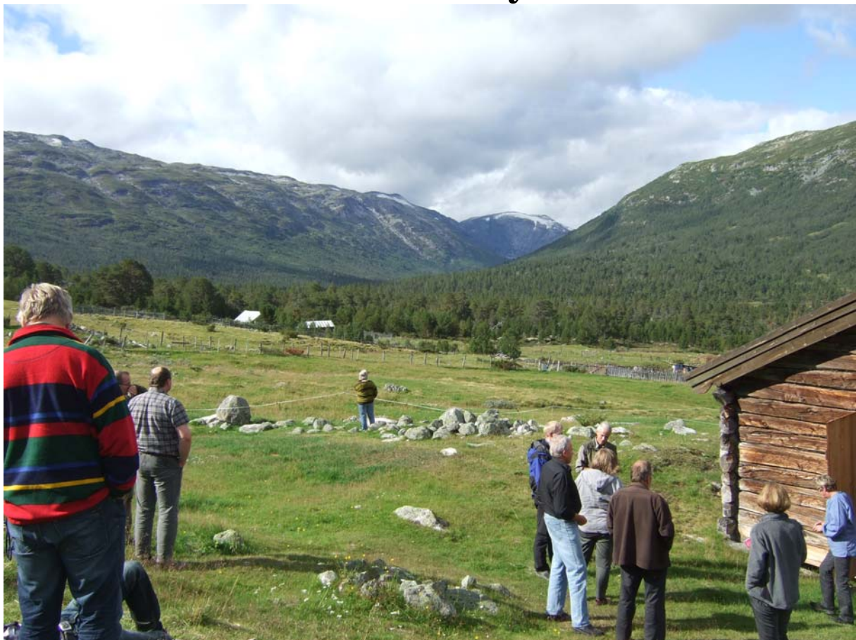
From Skjaak Bygd Commons/ Breheimen National Park, August 2010

Legislation translated from Norwegian by Julie Wille