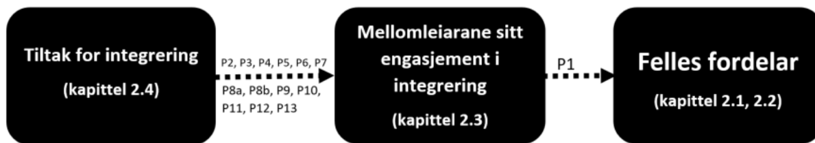
Figur 1: Modell for oppgåva. Figuren visar korleis teori og proposisjonar heng i saman.