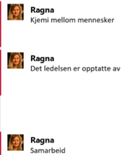
Figur 3: Døme på open koding. Ulike utsegn vart definerte ut i frå ord, uttrykk og meiningar som informantane brukte i intervjuet, og merka med ord, uttrykk og meiningar som eg såg som viktige, og hadde ein kopling til faktorar som kan vere knyta til mellomleiarar sitt engasjement i integrering og felles fordelar vart noterte.

B: Det er jo sånn menneskelig, det er sånn kjemi, det er sånn at noen går godt sammen, mens noen går mindre godt sammen. Noen har lyst til å ha styring selv andre vil mye mer samarbeide. Det er sånn. Det er jo sånn, det er jo mennesker som sitter her, og det er jo den slags ting som er med på å bestemme dette. Og så har du jo de spørsmålene om hva er det som er avgjørende for det er hva ledelsen er opptatt av. Langt på vei så blir jo folk, folk blir opptatte av det sjefen er opptatt av. Så det er veldig mye sånne ting som avgjør ikke sant. Og så er jo litt sånn noen utfordringer har en, det er jo at man må, de som styrer må levere, alle gjør det best mulig for seg selv, samtidig må det ikke bli sånn at hvis du gjør det godt for deg selv, så må du gjøre det for det hele. Det er det å finne systemer som på en måte gjør at ? At du ikke på en måte det er jo veldig stort du tjener noen ekstra kroner, men hvis det medfører at du taper mer penger på lang sikt så er det det å løfte, det på innenfor sin, hvis det lønner seg å gjøre en jobb ekstra i produksjonen for å gi salget bedre pris. så er det areit. men hvis det koster mer enn det en får ut selv så skal man ikke