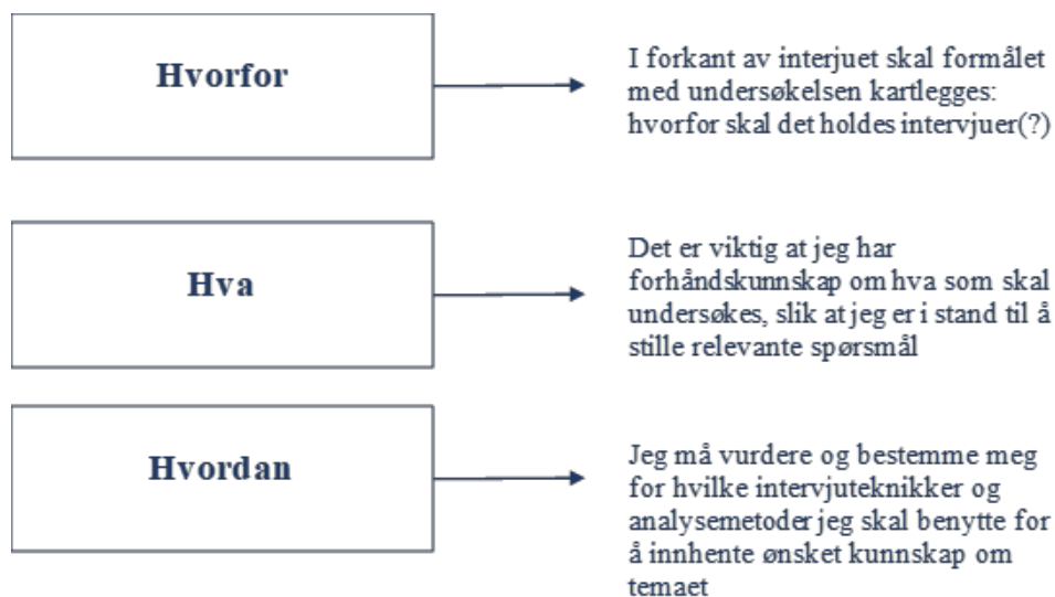
Figur 4 er basert på tekst fra Kvale og Brinkmann (2021, s. 138-140). Med tematisering viser Kvale og Brinkmann til intervjuets hvorfor, hva og hvordan.

I figur 4 oppsummerer jeg kort hva som menes med intervjuundersøkelsens hvorfor, hva og hvordan: