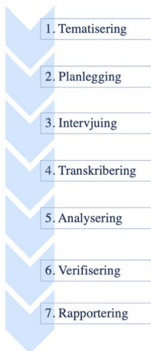
Figur 3 De syv faser av en intervjuundersøkelse (Kvale & Brinkmann, 2021, s. 137-138)

Figur 3 nedenfor er en fremstilling av fasene jeg tok utgangspunkt i ved planlegging og gjennomføring av intervjuundersøkelsen. Figuren er en oppsummering av Kvale og Brinkmann sin skissering av en intervjuundersøkelse sin lineære utvikling gjennom syv faser (Kvale & Brinkmann, 2021, s.137-138). Fig 7.4). Inspirasjon til figur 3 er hentet fra Trygstad (2022, s.39).