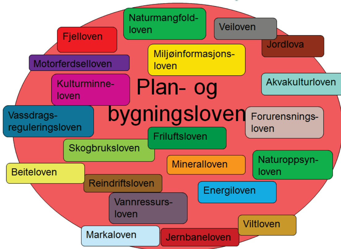
Figur 1: I tillegg til plan- og bygningsloven har en rekke lover betydning for utmarksforvaltningen. Listen er ikke uttømmende.

Planlegging etter plan- og bygningsloven er ment som en felles arena for avveining av ulike interesser knyttet til arealbruk. Det er flere forhold som begrenser planleggingens rolle som styringsmiddel i utmarksforvaltningen. Mens enkelte sektorlover er fullt ut integrert i plansystemet, slik som veiloven, gjelder andre forvaltningssystemer parallelt med, eller ved siden av, plansystemet, f.eks. energisektoren. I tillegg vil forslag om nye tiltak kunne endre forutsetningene i vedtatte planer. Gjennom dispensasjoner eller omregulering kan kommunene godkjenne tiltak i strid med arealformålet i eksisterende planer. Planer kan dermed bli oppfattet og praktisert som et utgangspunkt for, snarere enn et resultat av, forhandlinger.