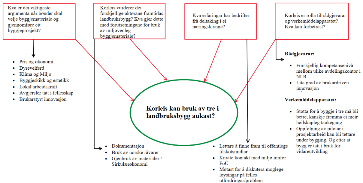
Figur 2: Oppsummering av funn frå dei forskjellige forskingsspørsmåla.

Figur 2 viser funna som kom fram under kvart av forskingsspørsmåla.