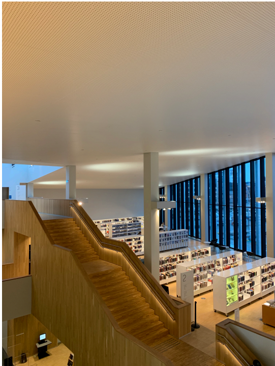
Stormen bibliotek

Med dette som utgangspunkt ble ungdomsvirksomheten “Unge Stormen” etablert som et forprosjekt. Forløperen til Unge Stormen, Stormtroppen, ble etablert tidlig i 2013. Hensikten med prosjektet var blant annet å kartlegge medvirkning som arbeidsform i offentlig sektor (Magnussen, 2016).