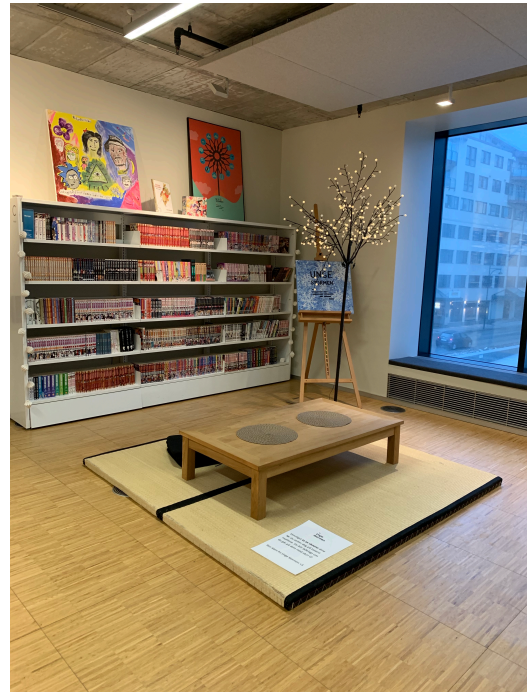
Ungdomsavdelingen på Stormen (egne bilder)