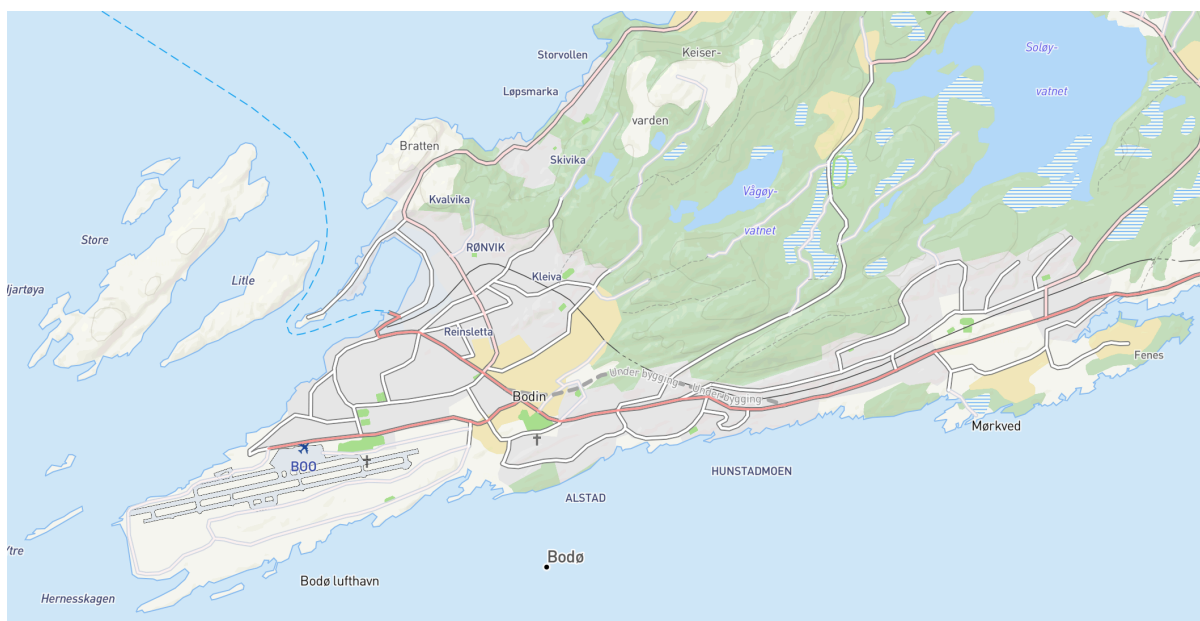
Bodø kommune.