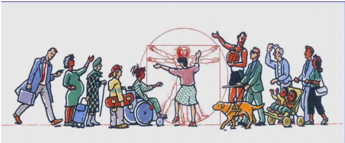
Fig. 1. Universell utforming handler om å planlegge for alle, tegnet av Ole Th. Bommen.