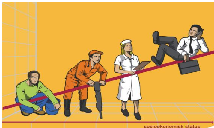
Figur 2. Viser gradientutfordringen. Tatt fra sosial og helsedirektoratets handlingsplan mot sosiale ulikheter i helse.

En erkjennelse av at sosiale forskjeller er sykdomsfremkallende og dermed medfører et samfunnsproblem som påvirker oss alle, har myndighetene gjennom nasjonale handlingsplaner iverksatt strategier knyttet opp mot funksjonshemmingspolitikk. (Meld.St.nr. 20 (2006-2007))