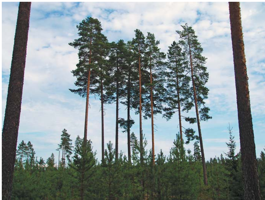
Etablert foryngelse 15 år etter gruppefrøtrestillingshogst i Romedal allmenning.

En grundigere beskrivelse av denne undersøkelsen finnes i Skogeieren, nr. 9-2009.