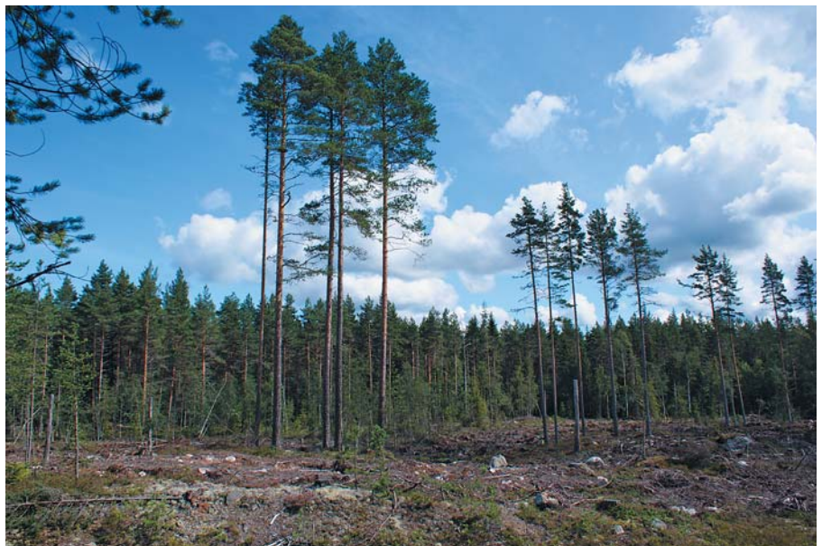
Nyetablert gruppefrøtrestilling i Romedal allmenning.

De undersøkte bestandene ligger ca. 350 meter over havet, fordelt mellom områdene