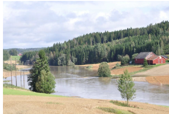
Grasdekte buffersoner i Morsas nedbørfelt hindrer tap av næringsstoffer ved normal vannstand, men andre tiltak må til for å redusere flomtoppene.

Effektiv bortledning av overvann kan også ha negativ effekt på vannkvalitet og biologisk mangfold i bekkene. Bekken får større vannføring enn normalt ved nedbør, noe som fører til økt erosjon. I tørkeperioder blir bekkene tørrere enn normalt fordi grunnvannsavrenningen blir redusert. Forholdene for organismer i bekkene blir mer ekstreme.