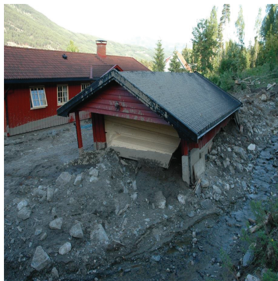
Flommer kan gi store skader på eiendom og kan være en risiko for liv og helse.