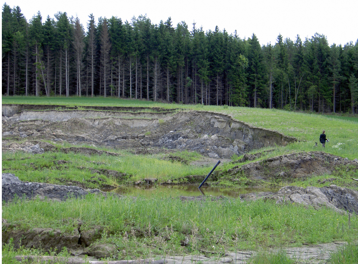
Kvikkleireskredet ved Hobøelva ved Våler i 2008 økte tilførsler av fosforrik jord til Vansjø.

renner gjennom kvikkleireområder. Et annet tiltak er å forsterke utsatte kvikkleireområder med kalksementpeler. Dette gir en umiddelbar styrkeforbedring av kvikkleira. NGI anser ikke at det mulig å sikre alle kvikkleireområdene mot skred, men kartleggingen er blitt brukt til å identifisere de områdene hvor kvikkleira innebærer en risiko for liv, helse eller skader på materielle verdier ( www.ngi.no ).