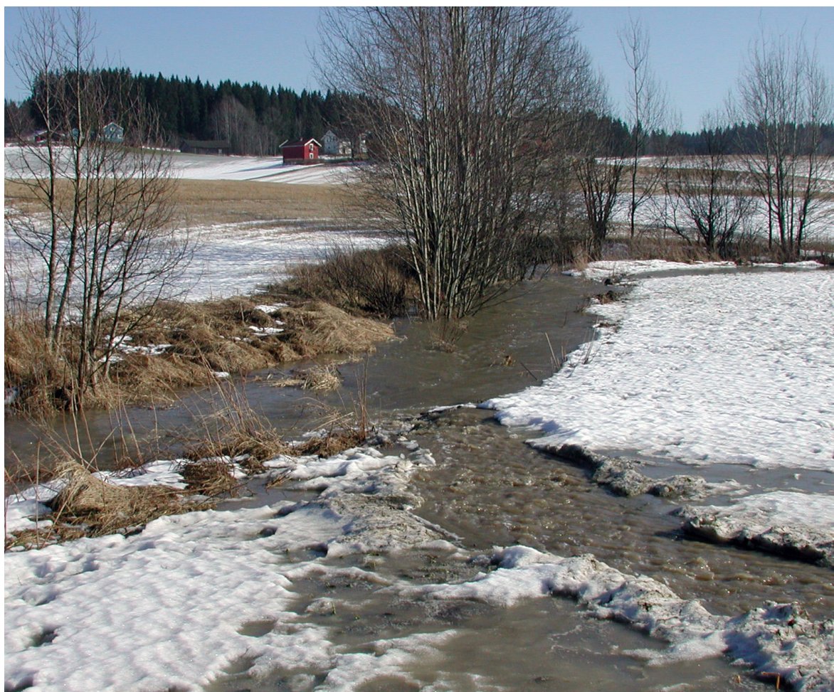
Jordtap kan øke ved klimaendringer med økt nedbør og flere flomepisoder.

tiltak, utbedring av hydrotekniske anlegg og fangdammer. I 2014 ble det innvilget mer enn 40 mill. kr til utbedring av hydrotekniske anlegg og fangdammer. I 2016 er SMIL-rammen på 95 mill. kr; i tillegg kommer 80 mill. kr til dreneringstilskudd. Gjennom ordningen med regionale miljøprogram (RMP) gis det årlig støtte til tiltak for å redusere erosjon og arealavrenning, så som redusert jordarbeiding, grasdekte vannveier og kantsoner. Dette er gode tiltak for å beskytte og ta vare på jord, redusere skader ved flom og redusere forurensning.