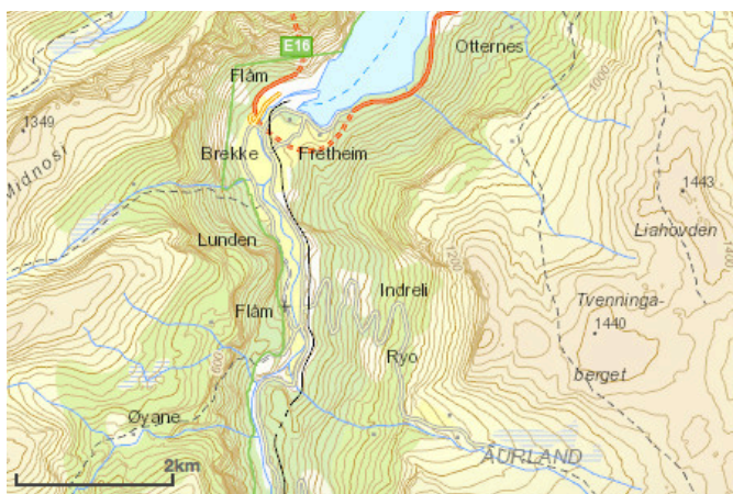
Figur 3: Kartutsnitt av bygda Flåm, inneklemt mellom høge fjell.