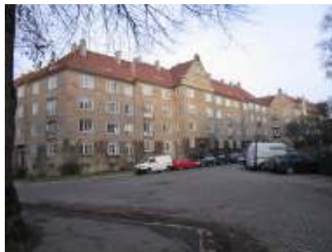
Figur 25. Fasade som vender ut mot plassen