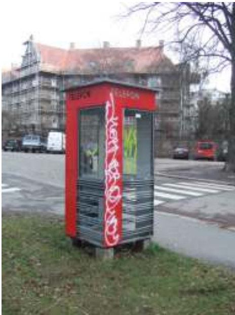
Figur 24. Gammel telefonkiosk