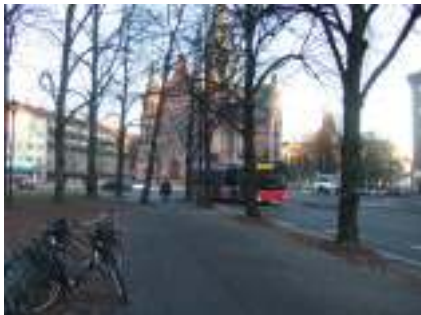
Figur 7 Trafikk