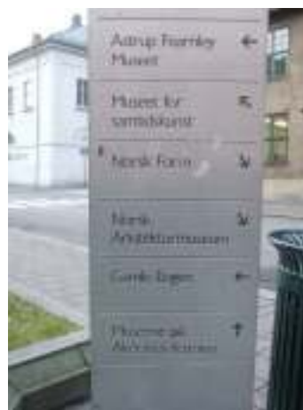
Figur 17. Museums område