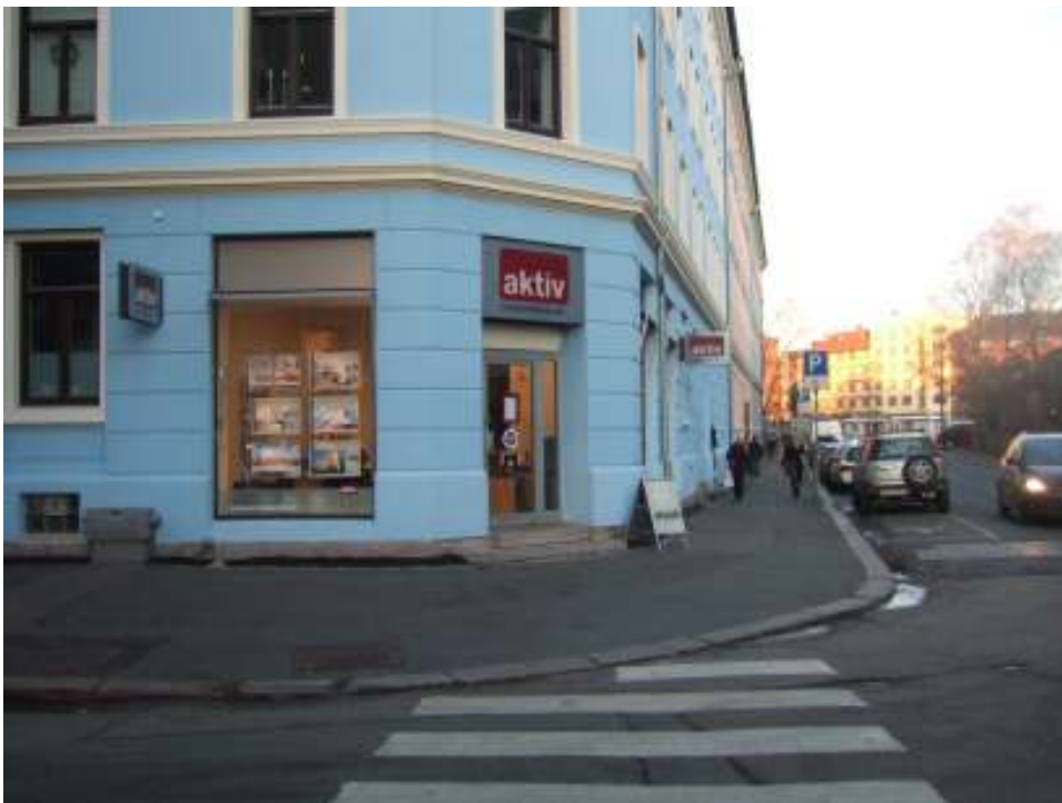
Figur 4 En av mange eiendomsmeglerfilialer på Sagene

Det er altså området rund kirken denne delen av oppgaven skal konsentrere seg om, selve studieområdet mitt er det som mange tenker på som sentrum av Sagene.