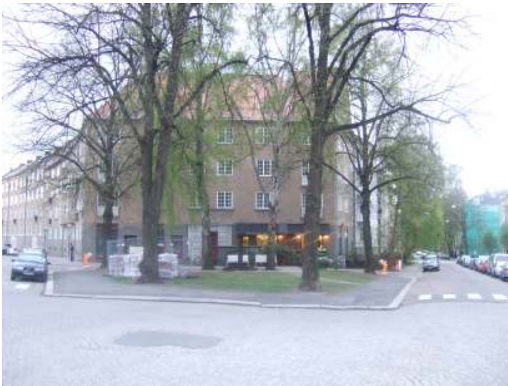
Figur 19 Jessenløkken