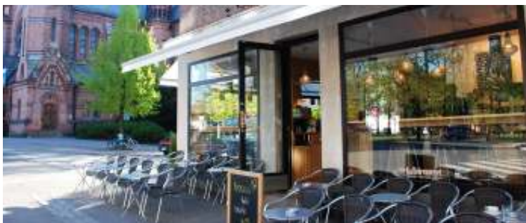
Figur 8 Uteservering, Kaffebrenneriet