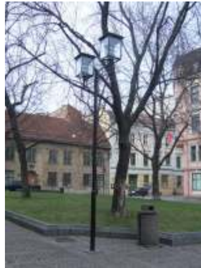
Figur 15. Grønt gress og store fine trær