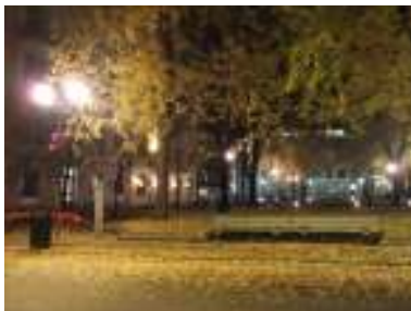
Figur 16. Godt opplyst om kvelden