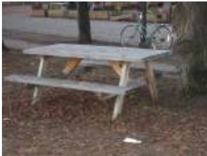
Figur 5 Benk

Her følger en liten bildeserie over ulike elementer som enten er med på gi området egenart eller andre elementer som kan virke både positiv og negativt i forhold til kvaliteten til plassen.