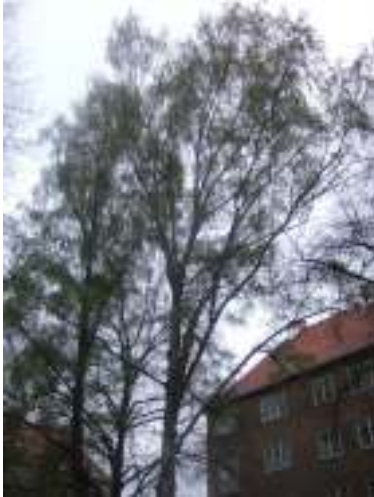
Figur 22. Stor flotte trær