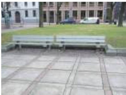
Figur 12. Sitteplasser