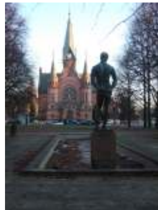
Figur 6 Både kunst og vannspeil(om sommeren)