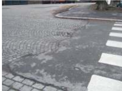
Figur 23. Blanding av brostein og asfaltdekke