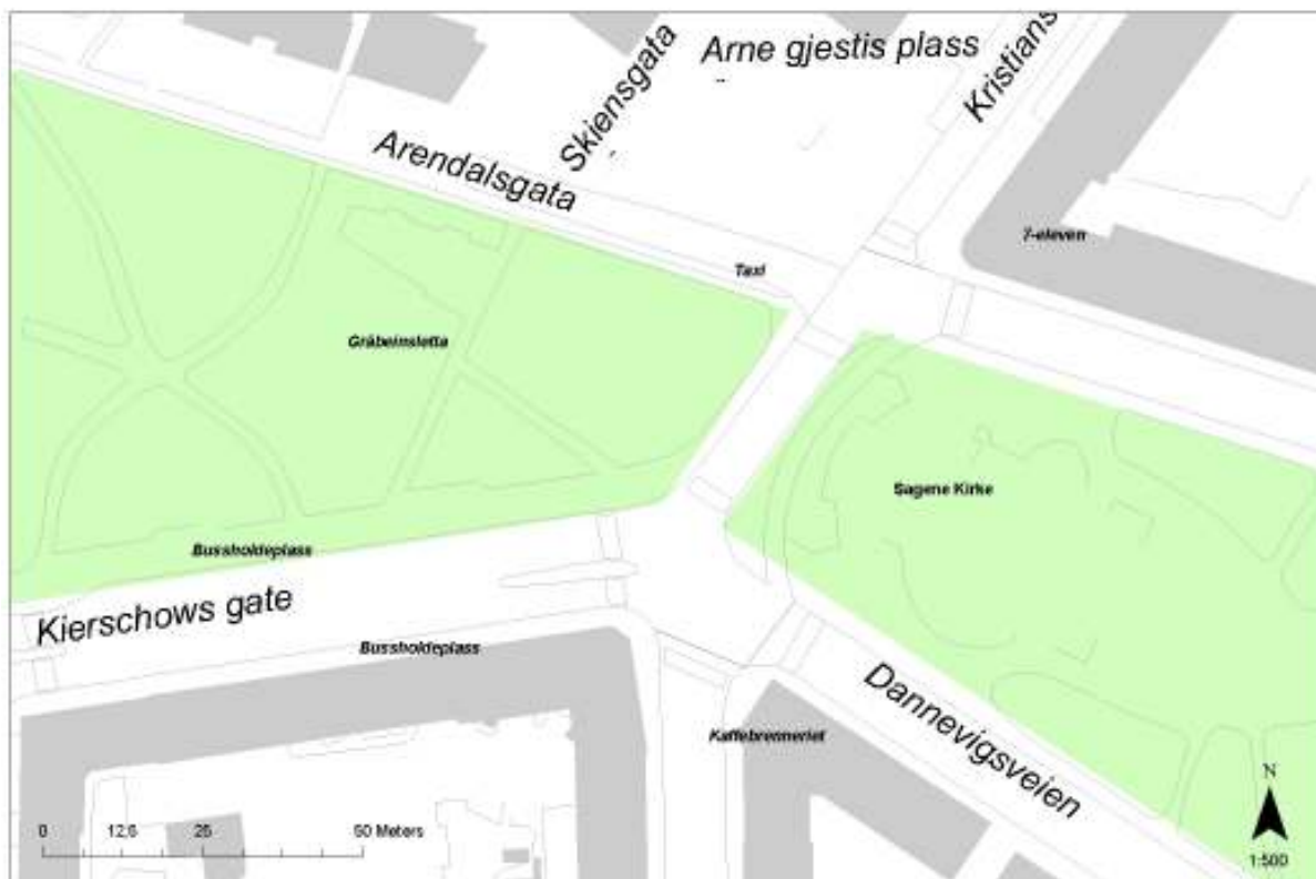
Figur 2 Oversiktskart over studieområde Sagene