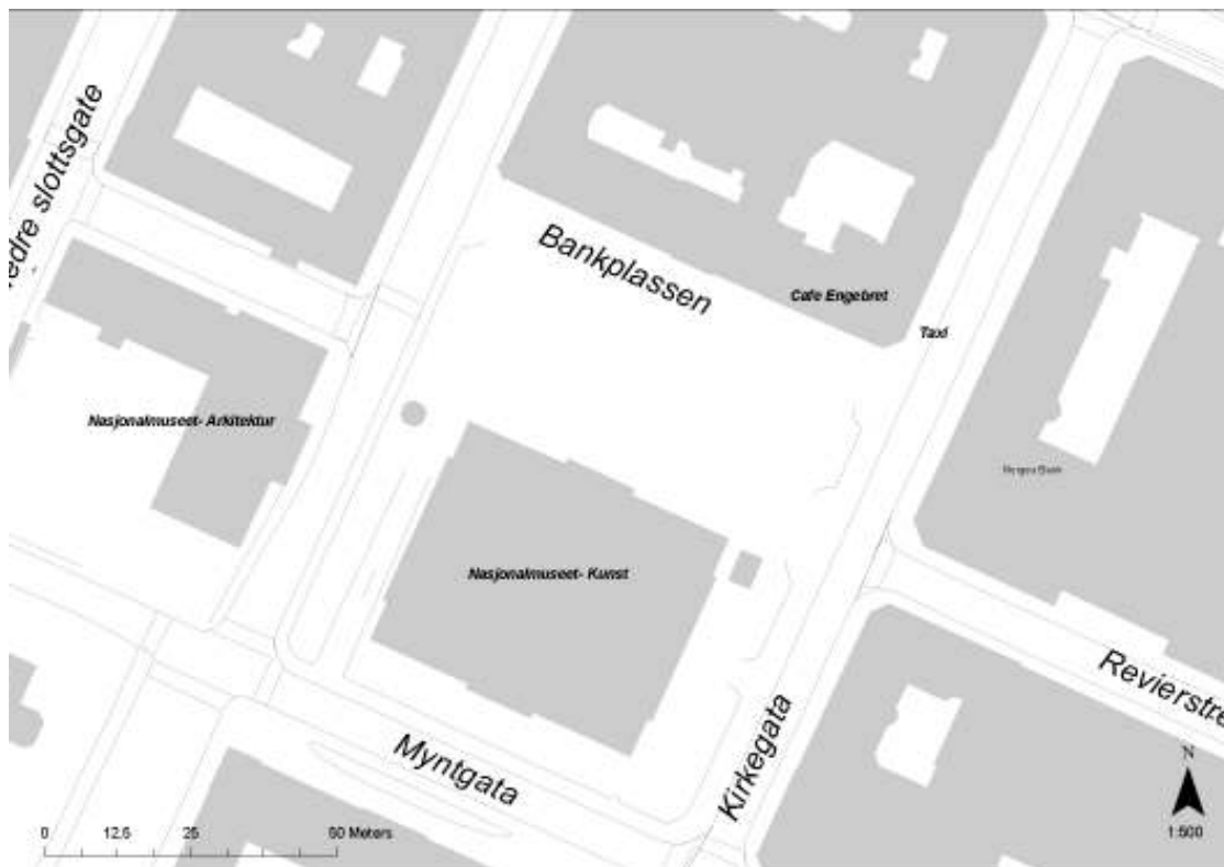
Figur 9 Oversiktskart over Bankplassen