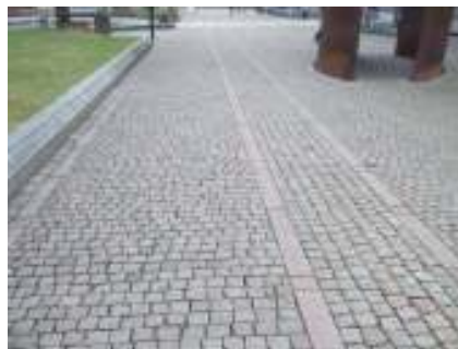
Figur 13. Brosteinsdekke