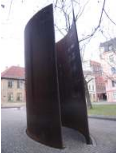
Figur 10. Richard Serras Shaft

Her følger en liten bildeserie over ulike elementer som enten er med på gi området egenart eller andre elementer som kan virke både positiv og negativt i forhold til kvaliteten til plassen.