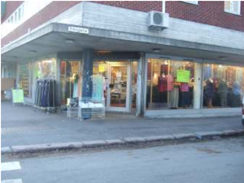
Figur 3 Butikk som ikke har blitt offer for gentrifisering enda