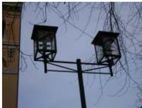
Figur 11. Belysning