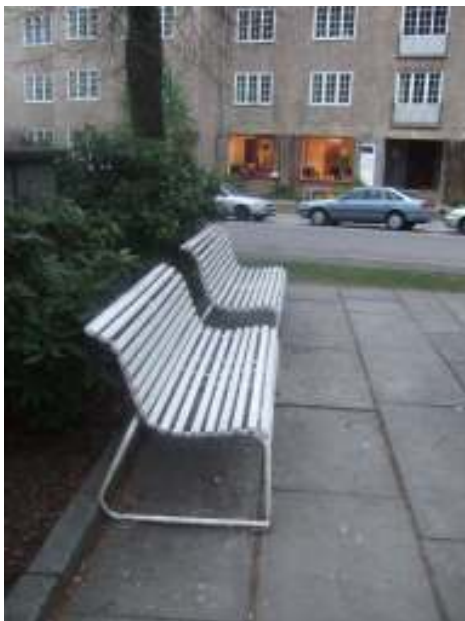
Figur 20. Benker

Her følger en liten bildeserie over ulike elementer som enten er med på gi området egenart eller andre elementer som kan virke både positiv og negativt i forhold til kvaliteten til plassen.