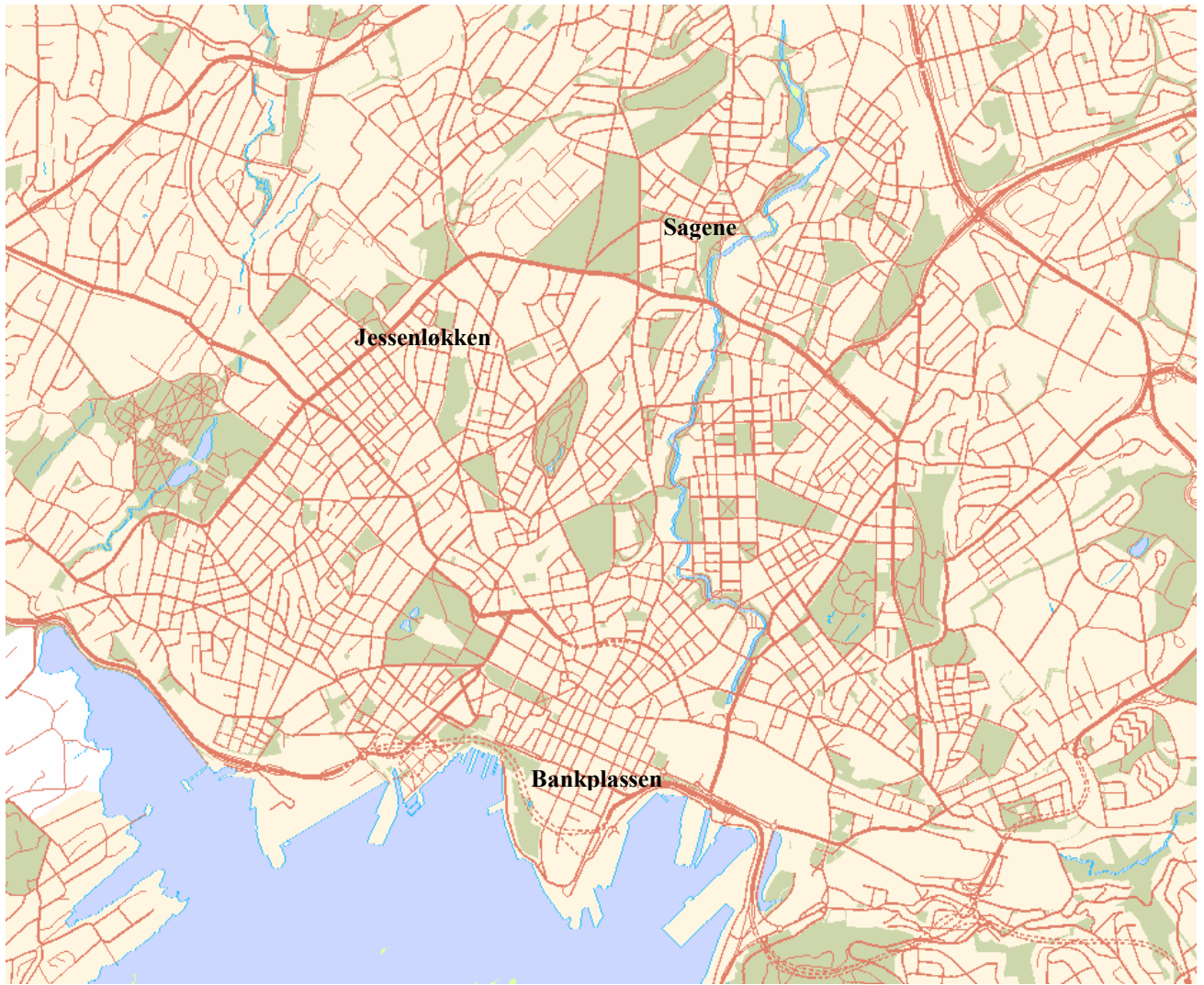
Figur 1 Oversiktskart over de tre studieområdene