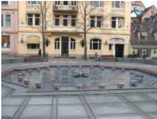
Figur 14. Vannfontene