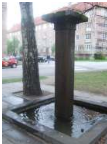
Figur 21. Vannfontene