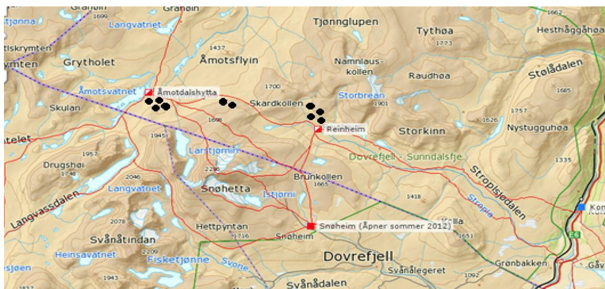
Figur 2: Dovrefjell nasjonalpark. Intervjuene ble utført ved de svarte markørene (DNT 2012).

Intervjuene ble foretatt på eller i nærheten av turistforeningens hytter Reinheim og Åmotdalshytta, og i Leirpulskalet. Lokalitetene er avmerket med svart. Målet var, i utgangspunktet, å oppsøke og komme i kontakt med naturbrukere som i liten grad benyttet