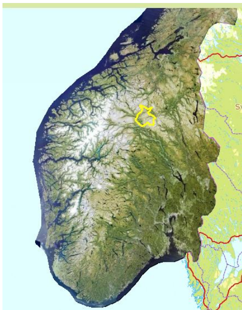
Figur 1: Kartutsnitt av Norge, Dovrefjell avmerket med gult omriss (Norsk Institutt for Skog og Landskap 2012).